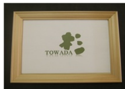
賞状額・ポスター額